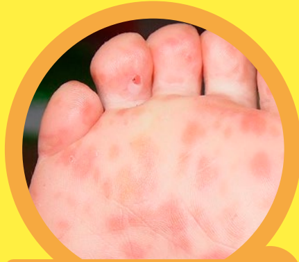
١ طفح جلدي