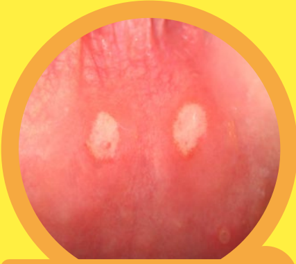
٣ التقرحات في الفم