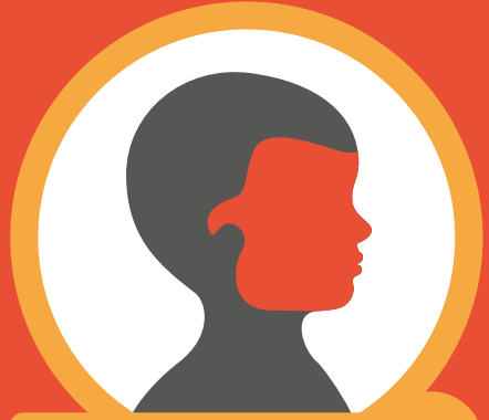
٢ الانتشار الأول